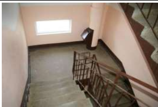
Dzīvojamā ēka ar kadastra apzīmējumu 1700 014 0393 001, koplietošanas telpa