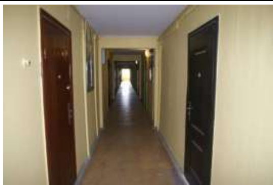
Dzīvojamā ēka ar kadastra apzīmējumu 1700 014 0393 001, koplietošanas telpa