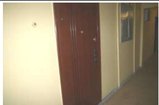
Dzīvojamā ēka ar kadastra apzīmējumu 1700 014 0393 001, dzīvoklis Nr.65