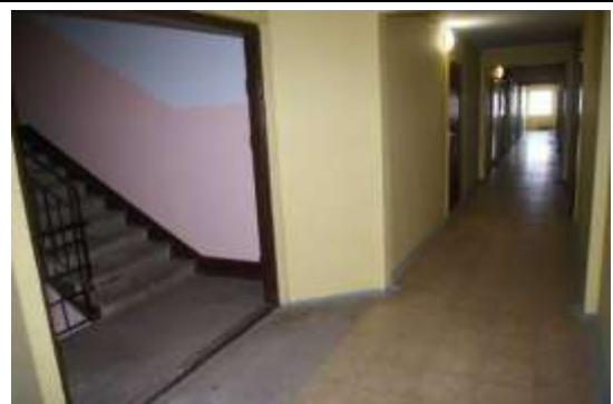
Dzīvojamā ēka ar kadastra apzīmējumu 1700 014 0393 001, koplietošanas telpa