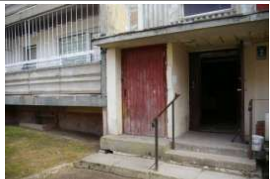
Dzīvojamā ēka ar kadastra apzīmējumu 1700 014 0393 001