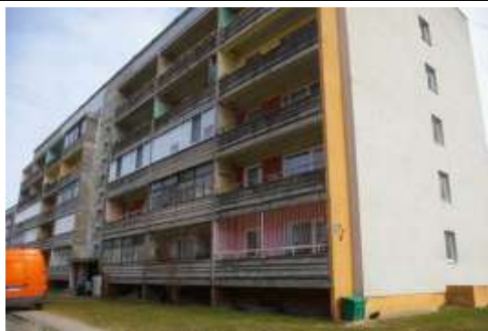
Dzīvojamā ēka ar kadastra apzīmējumu 1700 014 0393 001